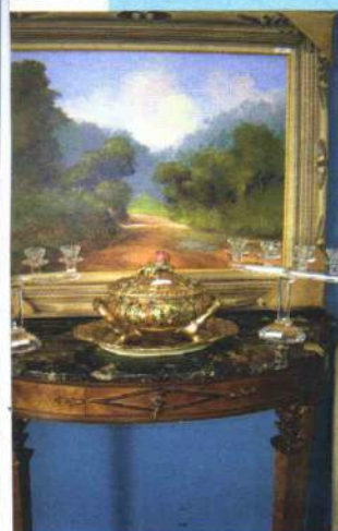
Peças de madeira, quadros e muitos objetos de decoração fizeram parte do leilão na AMATRA-SP