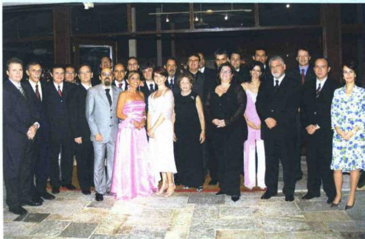
Nova diretoria da AMB em pose oficial no dia da posse em Brasília/DF