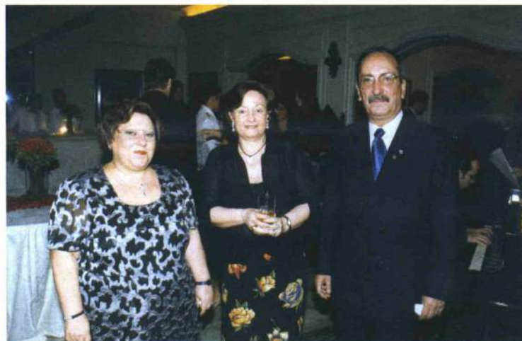
Organizadores da festa da AMATRA-SP ficam orgulhosos do resultado