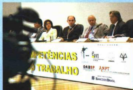
Todos os dias, grandes nomes do Direito debatendo a EC 45

O seminário foi organizado pela AMATRA-SP juntamente com a OAB/SP, AAT/SP, Escola da Magistratura do TRT/SP, ANPT e APAMAGIS.