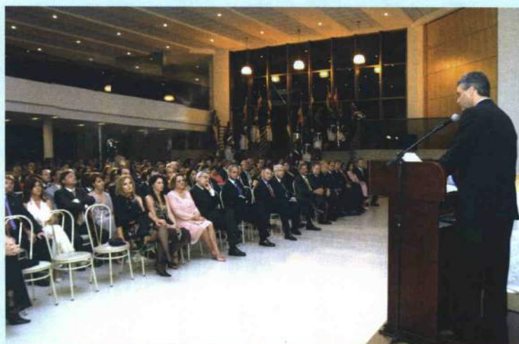
Vista panorâmica da platéia que assistiu a posse da nova diretoria da AMB