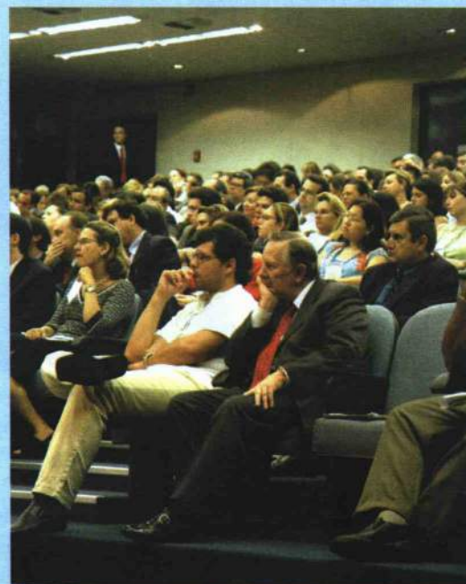
No auditório do Fórum Rui Barbosa não existia nenhuma cadeira vazia em todos os dias do seminário