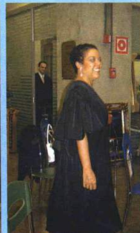
A exposição dos modelos das togas ficou por conta dos Juizes que desfilaram no evento